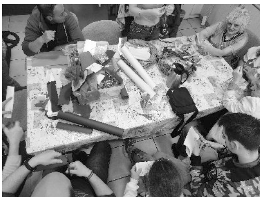
Μέλη του ΚΗ ΠΕΣΟΨΥ