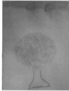
Φώτα και ζωγραφική: Στέλλα Κοκκόλη.

Σκέψεις, ιδέες και συναισθήματα που γεννιούνται: